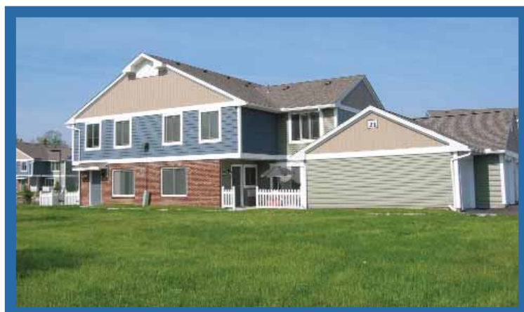
Stonewood Village—Henrietta, NY