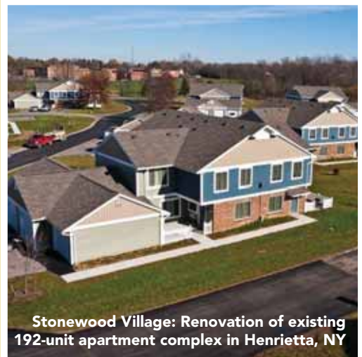
Stonewood Village: Renovation of existing 192-unit apartment complex in Henrietta, NY