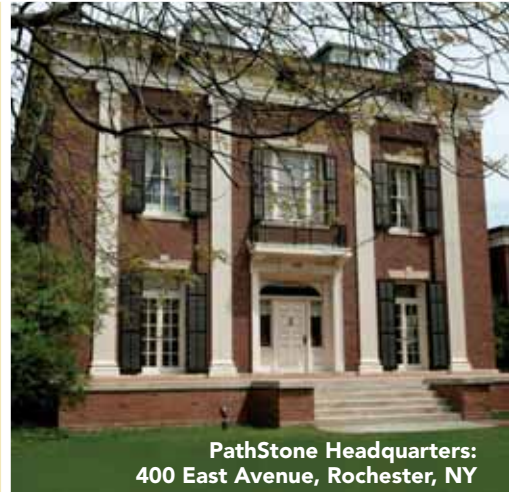
PathStone Headquarters: 400 East Avenue, Rochester, NY

Nathaniel General Contractors Building with Vision and Value 585.865.3020 www.nathanielgc.com