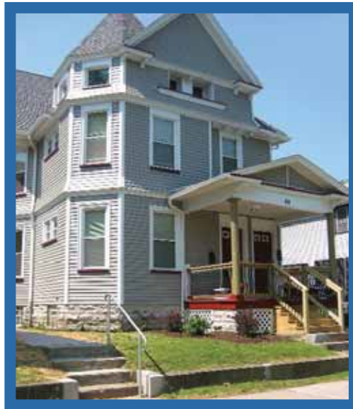
Bohrer Place—Rochester, NY