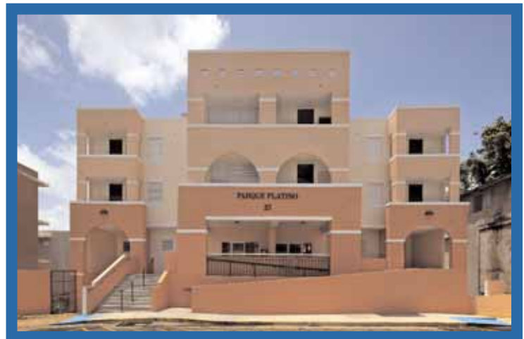
Parque Platino—Lares, Puerto Rico